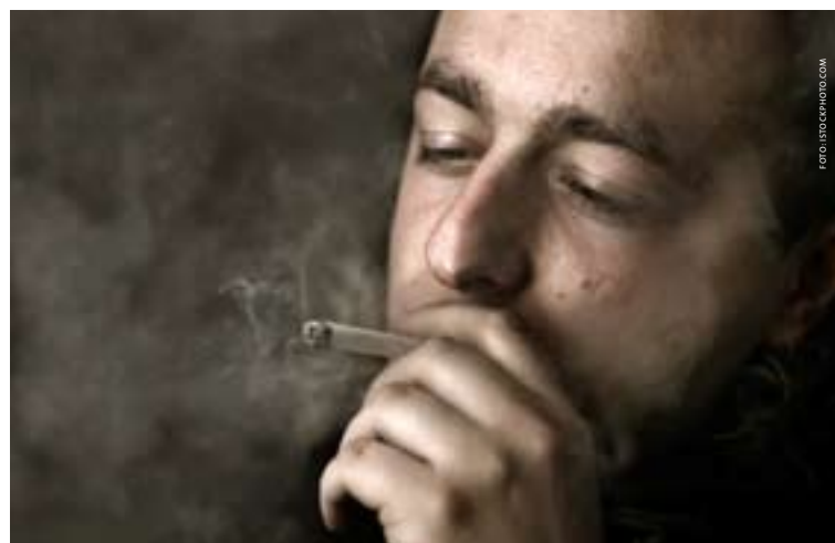
«Koser» vi oss syke?

støv og kjemikalier. Det er med andre ord bare du som kan gjøre noe med det. Ikke utsett bedring av helsen og lommeboken, ta kontakt med fastlegen og få et trygt røykeslutt opplegg.