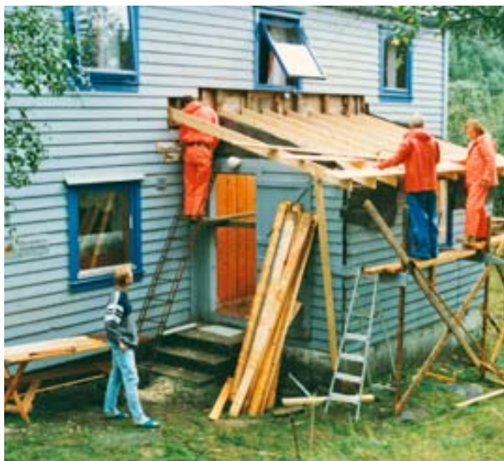
Dugnad på Sagatun.

Hytten ble mye brukt i sommermånedene. Men i 1962 kjøpte foreningen et nedlagt småbruk på Bognøy i Herdla, og hytten i Breivik ble solgt. Bognøy ble satt i stand og flere medlemmer ferierte der i årene etter. Ferien var fra 1947 blitt utvidet til tre uker, fra 1967 ble den fire uker. Men fra begynnelsen av 1970-årene måtte malerne mer og mer ta ferien som fellesferie, og det skapte problemer for feriehemstyret. Det ble kø for å bruke feriehemmet i tre uker i juli, mens det resten av sommeren ble stående tomt. Fram til 1950-årene var det stor søkning til feriehemmene. Mange ville bruke dem og oppholdene måtte rasjoneres. Etter hvert fikk og mange av medlemmene råd til å skaffe seg sine egne feriesteder.