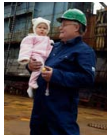
Pensjonsforliket gjelder alle – helt fra du blir født

Det er elementer i stortingets pensjonsforlik som ikke kan aksepteres som endelige. Dersom du velger å gå av før fylte 67, vil du få en avkorting i pensjon som følger deg livet ut. Da vil alle som har betalt skatt og «levert til folketrygden», få tilbud om Tidligpensjon fra fylte 62 år, betalt med vel 130.000 kroner i året for vanlige lønnstakergrupper. Det er selvsagt ikke mye, men for dem som ikke hadde muligheten før, er 130.000 mer enn 0. Det er altså et fremskritt