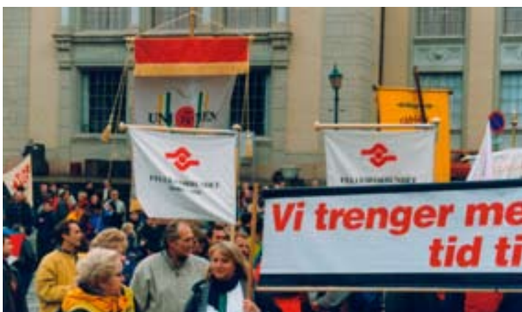
«Vi trenger mer, ikke mindre, tid til hverandre», ble benyttet da Norge stanset den 15.10.98, da regjeringen ville ta fra oss en fridag.

ers lønnet fri i tariffrevisjonen etter en voldgiftsdom for jernindustrien og ferieretten var dermed samfunnsmessig godtatt.