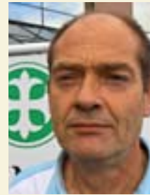
Jan Haugland Pilkington AS