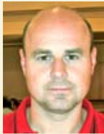
Kjartan S. Dalstø LAB AS