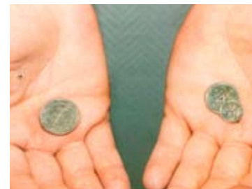
Skal vi i fremtiden bli avspist med småpenger hvis vi går av med AFP?

Da hadde 37 000 jernarbeidere vært ute i konflikt for første gang siden 1924 etter at 54 prosent den 10. mai sa nei i første runde. I Bergen stemte 70 prosent ja i annen runde.