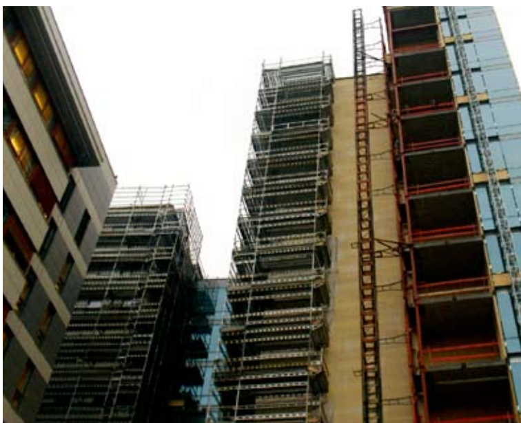
«Nonnen» – et mønsterbygg for HMS?

► TEKST: ROGER PILSKOG