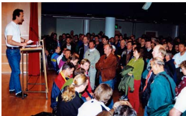
Må det streikes for AFP også i år?

Tidligpensjon var og ett av kravene til bygningsarbeiderne i Fellesforbundet. Her kom partene fram til et forslag som kunne anbefales sendt ut til uravstemning etter å ha forhandlet fem timer på overtid. Den 23. august vedtok medlemmene i byggfagene det nye meglingsresultatet etter at det første avtaleforslaget var blitt nedstemt med 58,9 prosent nei stemmer.