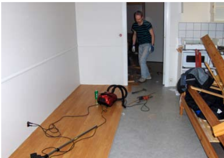
Roy i full gang med å tilpasse nytt gulv.

Unionen Fagforening gikk til innkjøp av ferieleiligheten på Tysnes som var bygget rundt 1994. Standarden på leiligheten bar preg av dette. Styret ønsket å modernisere den slik at den fremsto mer delikat for våre medlemmer. Som et resultat ble dugnadsgjengen Hytteutvalget opprettet.