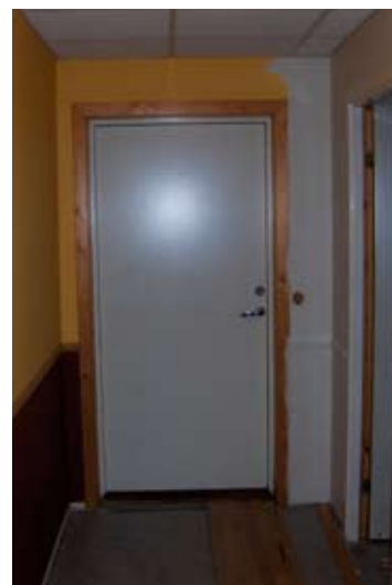
Originale farger: Gul med rød brystning. Lakkerte furulister.