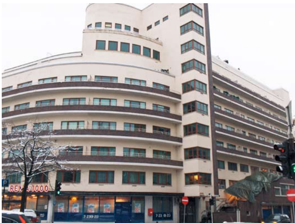
Kalmarhuset, den første malerjobben i Bergen som ble målt. Utførende malerfirma: Johs. Mikkelsen & Sønn.

I en artikkel i Medlemsbladet til malerne i Bergen, beskrives det hvordan dette fungerte i 30-årene i malerfaget. – Med en ledighet på opptil 50 prosent som det var den gangen, kunne man bare se på forholdene på arbeidsplassen, særlig når det gjaldt større byggearbeider. Mestrene ga sine anbud, og i den sterke konkurransen var de som oftest svært billig på arbeidet. Om de da skulle tjene penger, måtte de plukke ut de beste folkene som fantes. Dette gjorde de ved at de som var ledig ble notert opp, og etter hvert som mesteren da kunne ta inn folk, plukket han ut de han mente kunne gjøre best nytte for seg. Disse