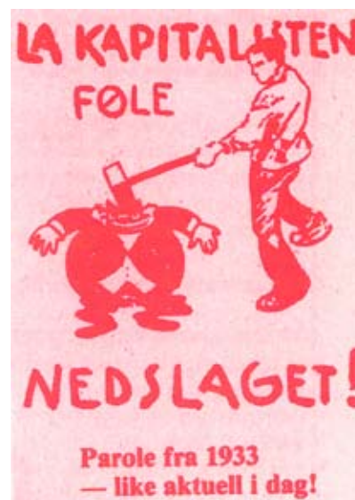
Tegning fra Nytt fra Bygning/Fellesforum.