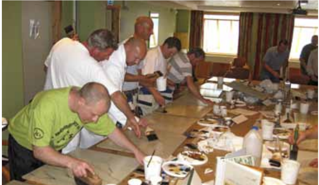
Kursdeltakere i full konsentrasjon.

Lørdagen brakte muligheter for omsette teori til praksis. Først hadde vi en gjennomgang på hvordan vi skulle lage lasuren, før vi gikk til verks. Det var mange fantasifulle tresorter som åpenbarte seg etter hvert. Dette