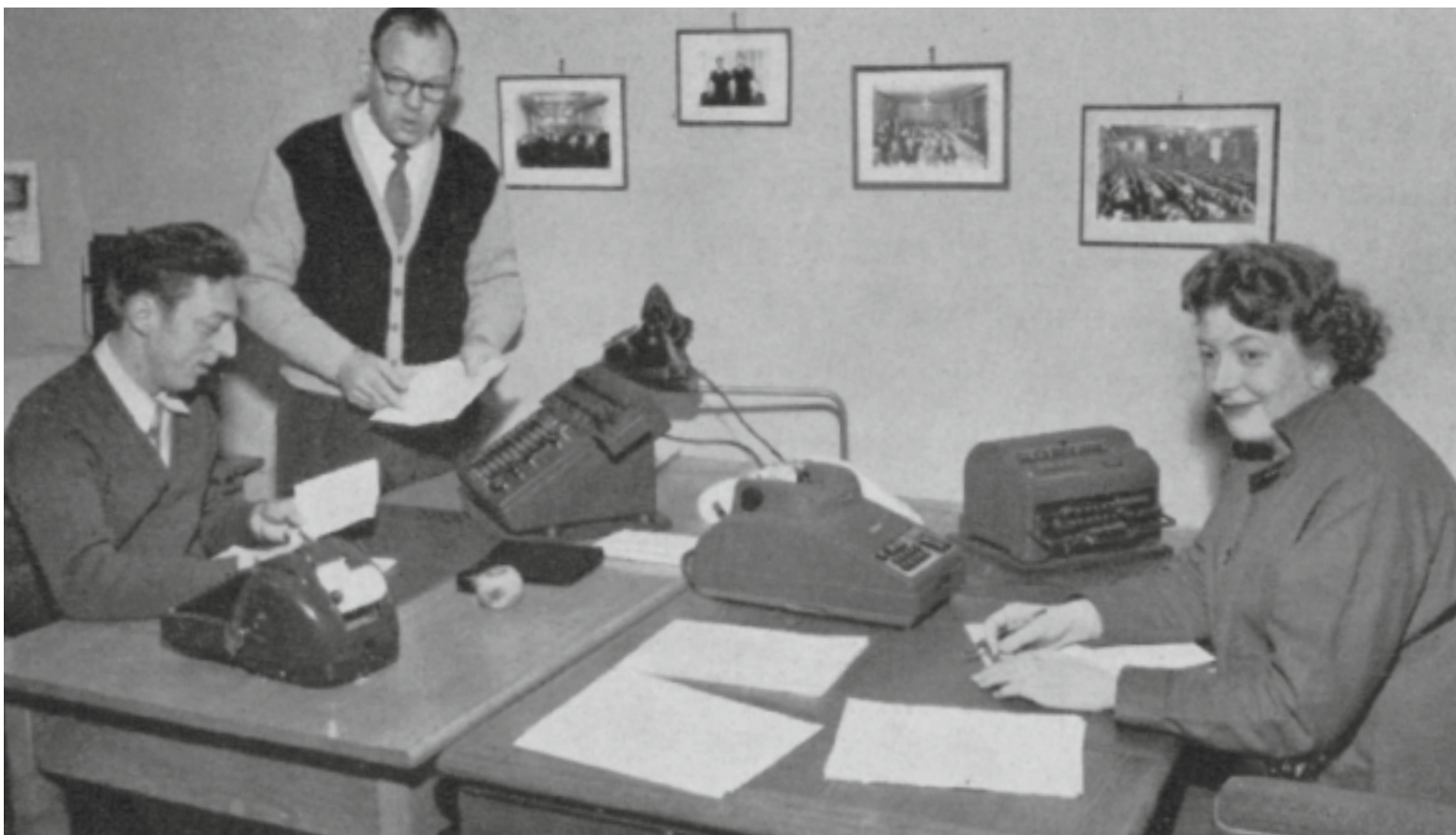
Fra målekantoret i 50-årene.

fremdeles søkte å stampe mot utviklingen, og enkelte av foreningens medlemmer var, mest uten å ville eller vite det, arbeidsgiverne behjelpelig i denne kampen.