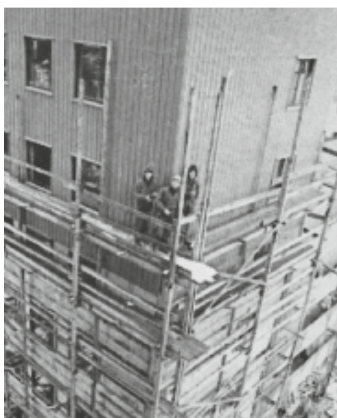
Fasadetekkere på Storhammaren.