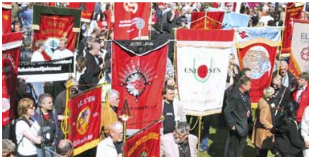
Blir det konflikt også i tariffoppgjøret i 2010?