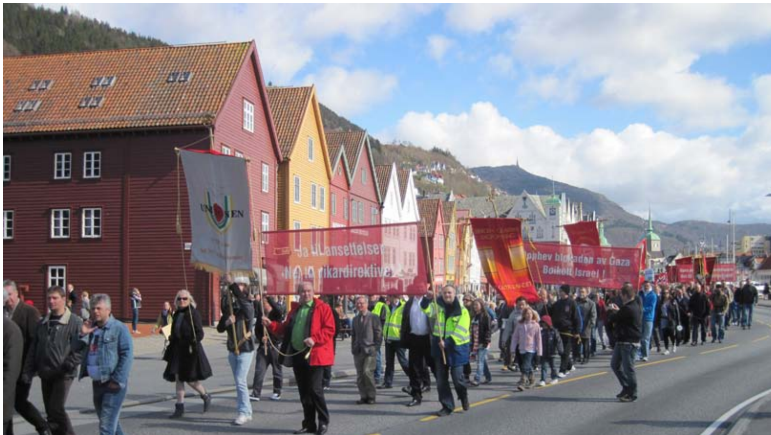
Unionen Fagforening passerer Bryggen.