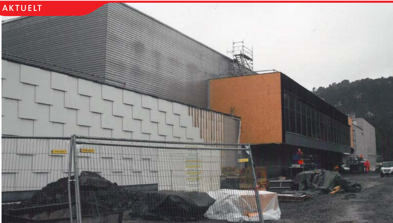
Nytt treningsanlegg på Håkonsvern.