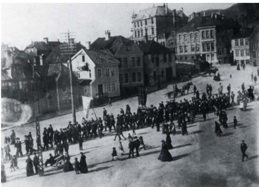
Bilde fra Malersvennenes 100års beretning.

Den 2. internasjonale kongress i Paris i 1889, vedtok å gjøre 1. Mai til internasjonal demonstrasjonsdag for kravet om 8 timers arbeidsdag. Bildet er hentet fra en 1. mai demonstrasjon i 1890- årene, da toget passerer Engen. Men allerede 1. Mai 1890 gikk det første toget under «Verdensbanneret» i Bergen.