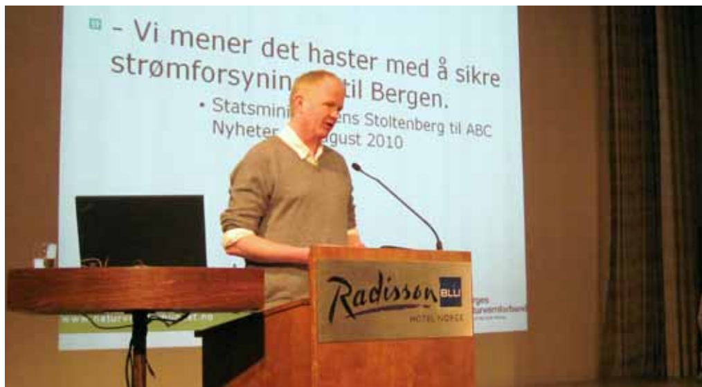
Bildetekst kommer her

For det andre, skal mastene overhodet ikke stå i fjordlandskapet. De vil heller ikke bli synlige hvis man befinner seg på fjorden. Og selve kraftlinjene skal gå i et luftstrekk mange hundre meter opp i luften (i Granvinsfjorden går linjen 350 meter over fjorden), i Fykkesund går den nesten 1 000 meter opp i luften).