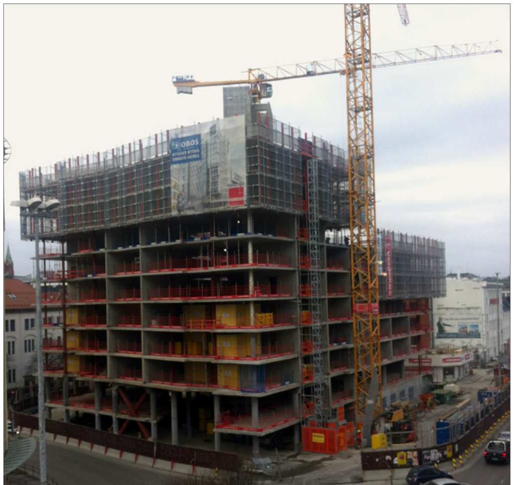
Rica Park ruger alt godt i bybildet. Sikringsskjermene ruger også godt på toppen av bygget. Her er fasaden mot Bjørns gate og Fjøsangerveien. Som en ser går tomtegrensen i fortauskanten.

Når støpingen er ferdig begynner en også med å heise på plass baderomskabinene. Totalt skal 365 baderomskabiner finne sin plass i bygget. Så i uke 10 vil en begynne på fasademonteringen. En fasadekonstruksjon dekker akkurat et hotellrom og kommer ferdig med innsatt vindu. Veidekke har et eget mellomlager for oppbevaring av fasadekonstruksjonene.